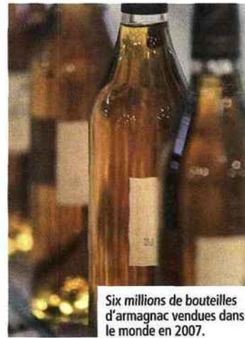
Six millions de bouteilles d'armagnac vendues dans le monde en 2007.