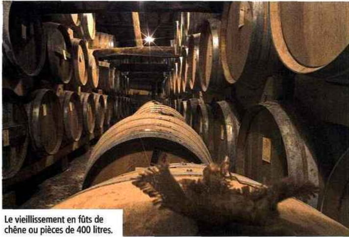
Le vieillissement en fûts de chêne ou pièces de 400 litres.

Devant la montée des marchés à l'export, l'armagnac prépare son avenir en affirmant son identité et en prévoyant, à terme, un doublement de la production.