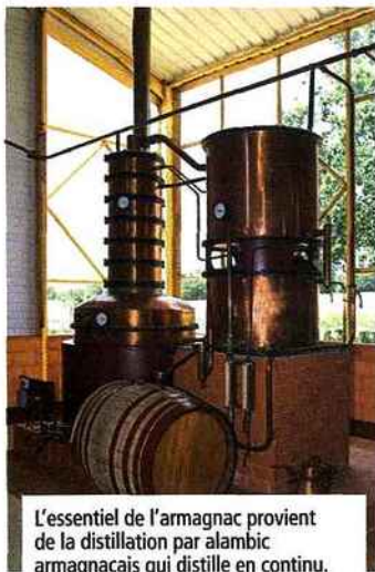
L'essentiel de l'armagnac provient de la distillation par alambic armagnacais qui distille en continu.